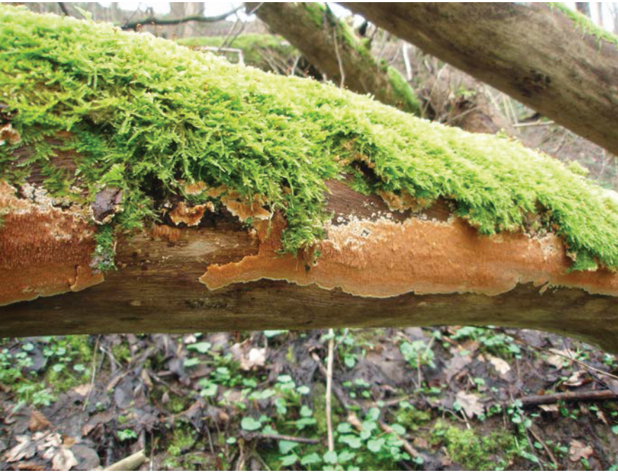
Den rödlistade (VU) prakttaggingen ( Steccherinum robustius ) på almlåga i Gunnaredsravinen i Lärjeåns dalgång.