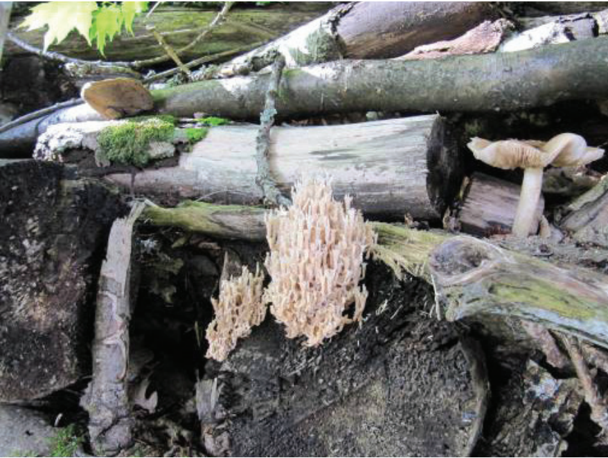
Den rödlistade kandelabersvampen, med flera på asp i upplagd vedhög.