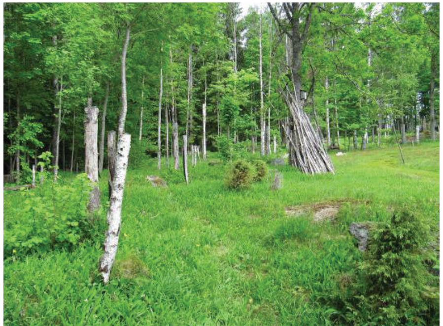
Högstubbar i slåtteräng.