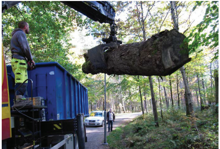
Grov ekstock på väg ut i naturen, Delsjöområdet, oktober 2010.

Förslagen syftar även till en strategi för att uppfylla miljö kvalitetsmål och förvaltningens egna målsättningar i naturvårdsprogrammet om att öka mängden död ved. De innebär också en anpassning till Naturvårdsverkets nya mål för särskilt skyddsvärda träd.