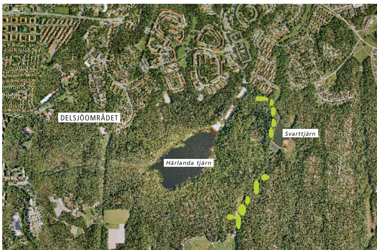
Exempel på område för utkörning av solitärer - vid gångvägar i Delsjöområdet.