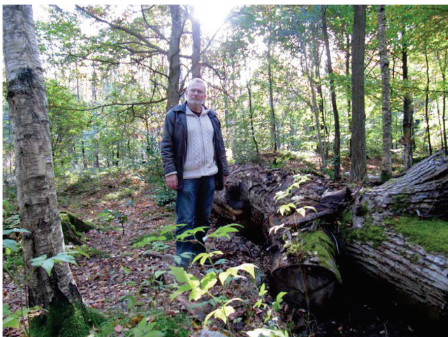
En grov ekstock har körts ut i Delsjöområdet som solitär.