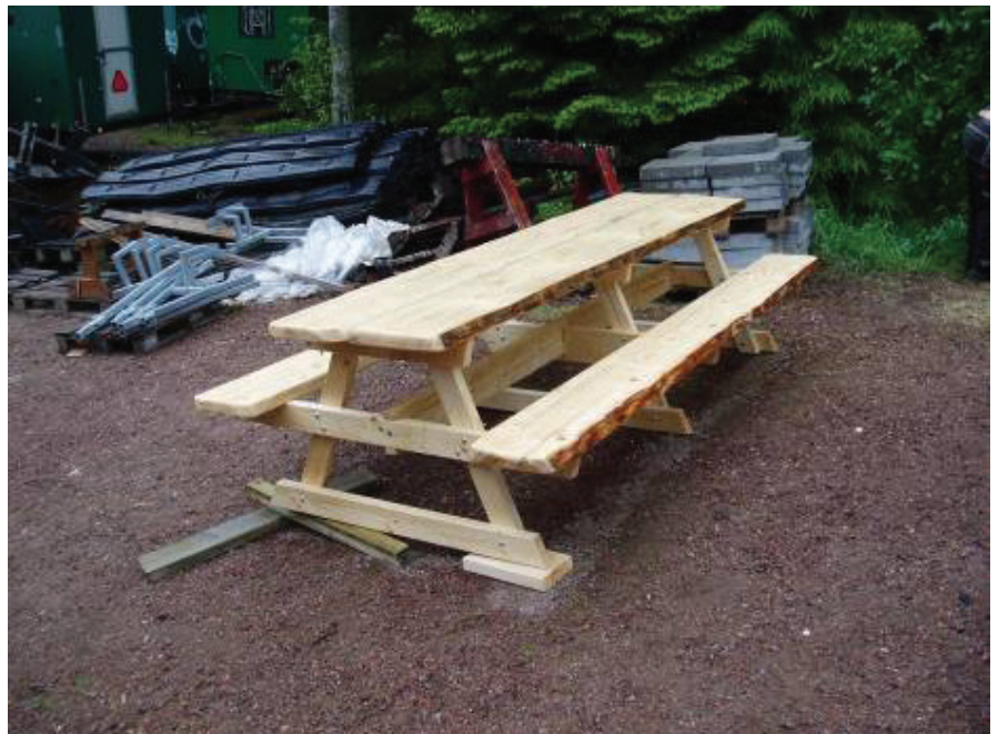
Rustikt bänkbord med vankantade brädor.