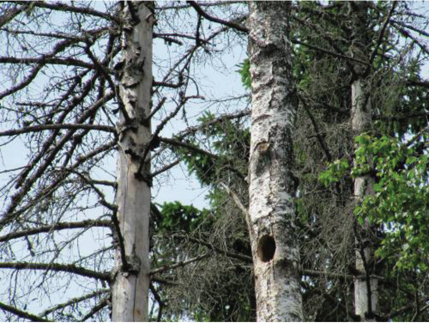
Döda granar ger föda och död björk bohål till hackspettar.