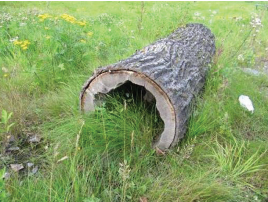
Gömställe och skydd.