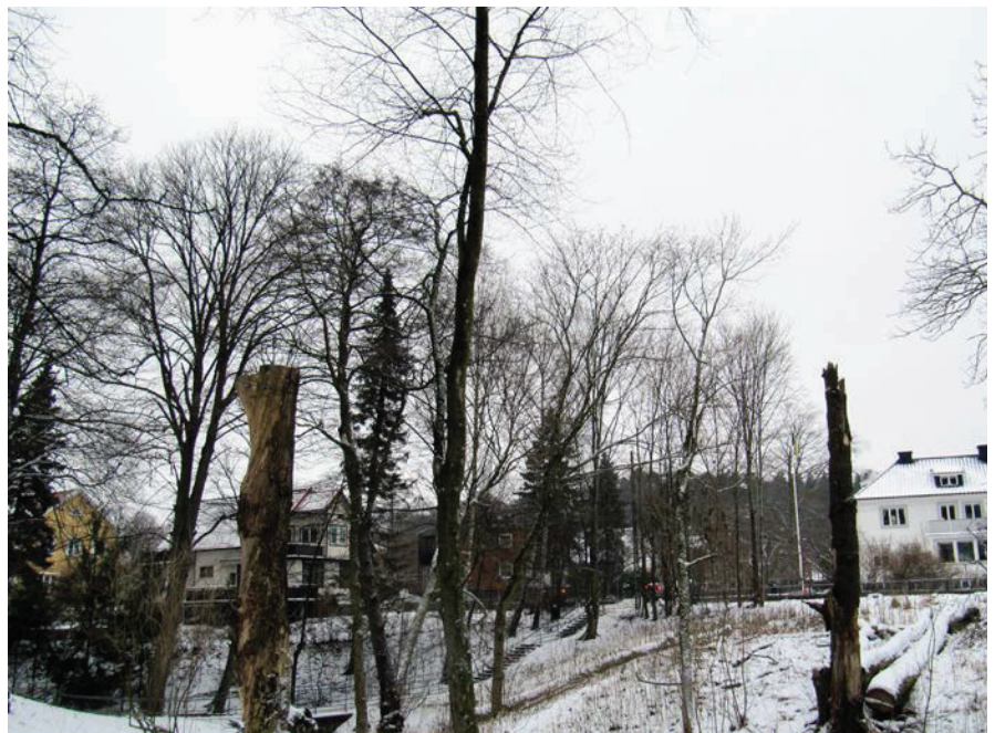
Exempel på omfattande naturhänsyn i parkmiljö.