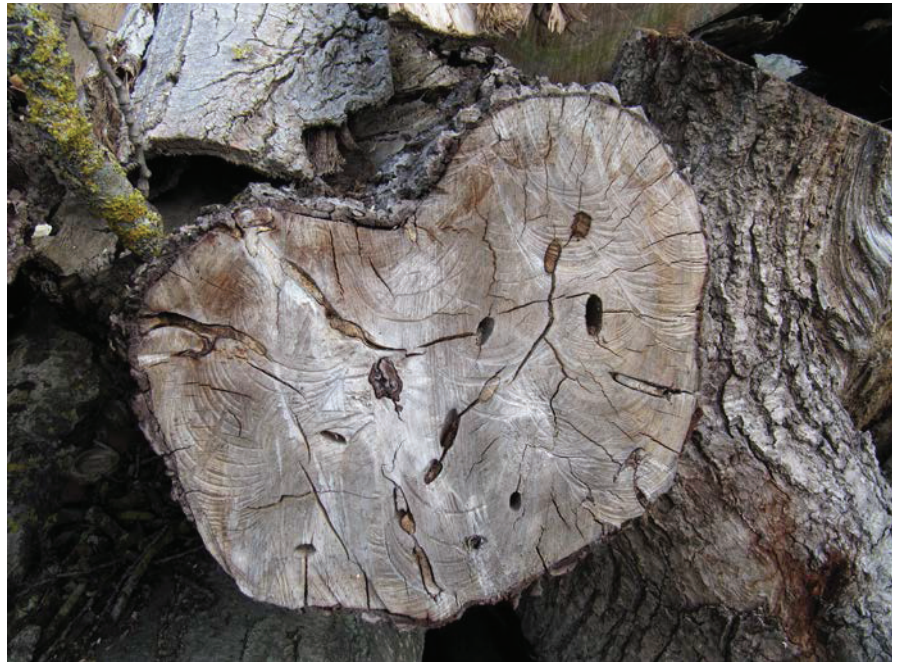
Det finns liv i de döda träden - larvgångar.