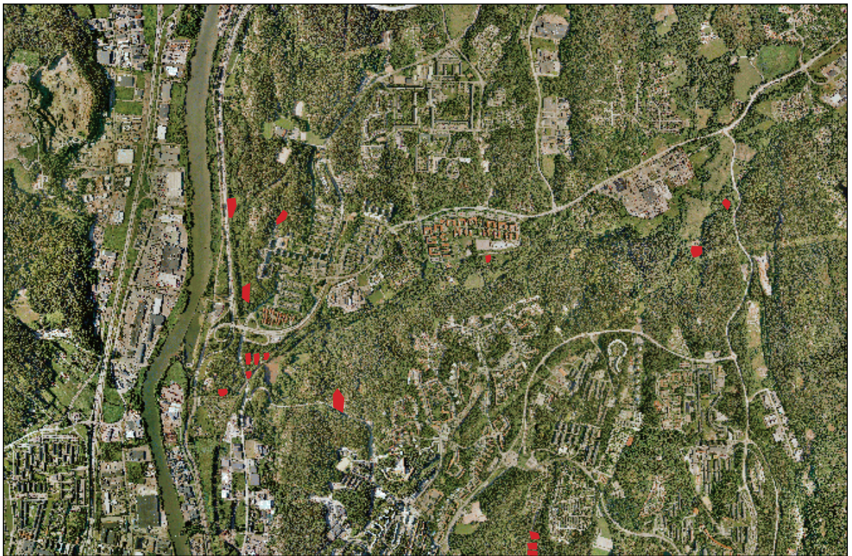
Lokaler med biodepåer (röd markering) – Hjällbo - Linnarhult.