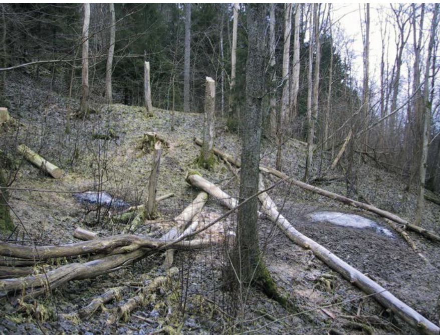
Döda almar i ett naturligt bestånd i Lärjeåns dalgång.