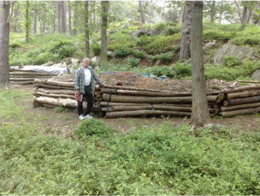
Slanor har använts för att avgränsa en kompost.