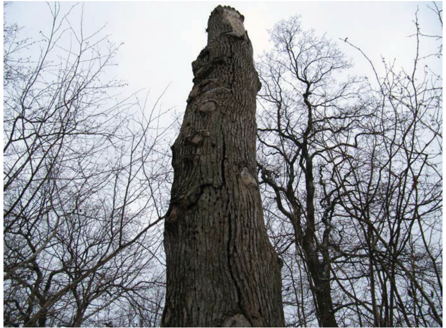
En ordentlig högstubbe av ek har skapats i parkmiljö. Troligen står den kvar i decennier, Överåsparken, Göteborg 2010.