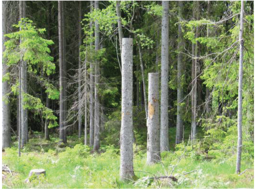
Aktivt skapade högstubbar i samband med avverkning.