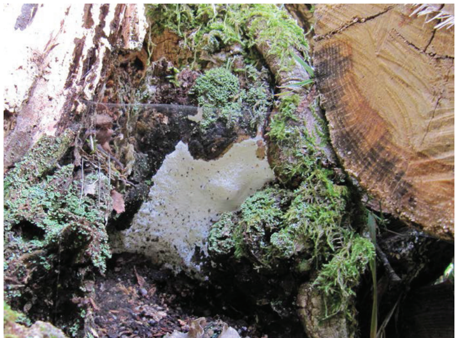
Den rödlistade och sällsynta brödmärgstickan på döende ek. Stocken till höger har lagts upp för svampens spridning.