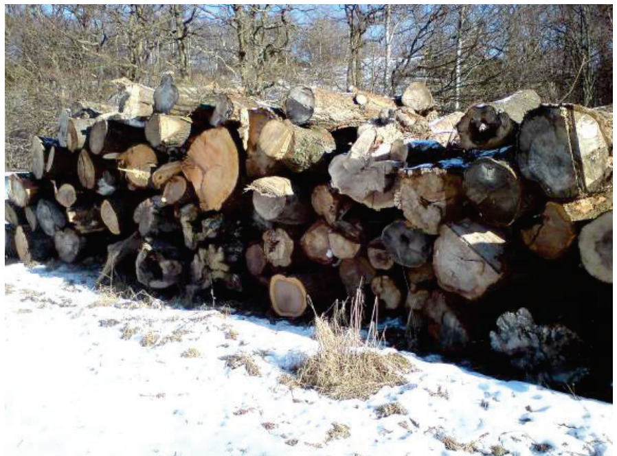
Ett större antal stockar – olika trädslag och grovlek – har lagts upp som biodepå i Hjällbo.