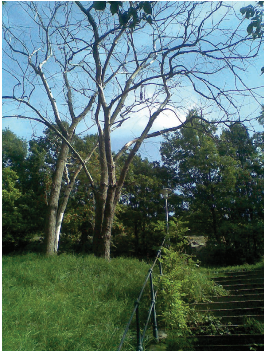
Döda almar i parkmiljö.