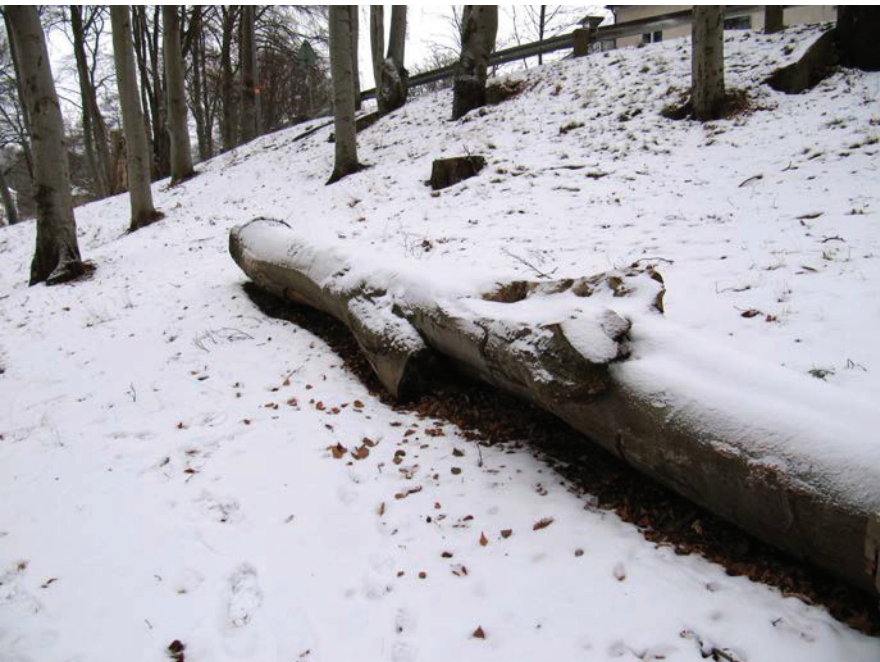
En grov boklåga i sluttning i parkmiljö, Delsjöbäcken, Göteborg.