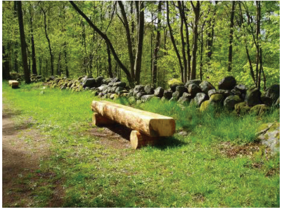
Enkel bänk av grovt virke.