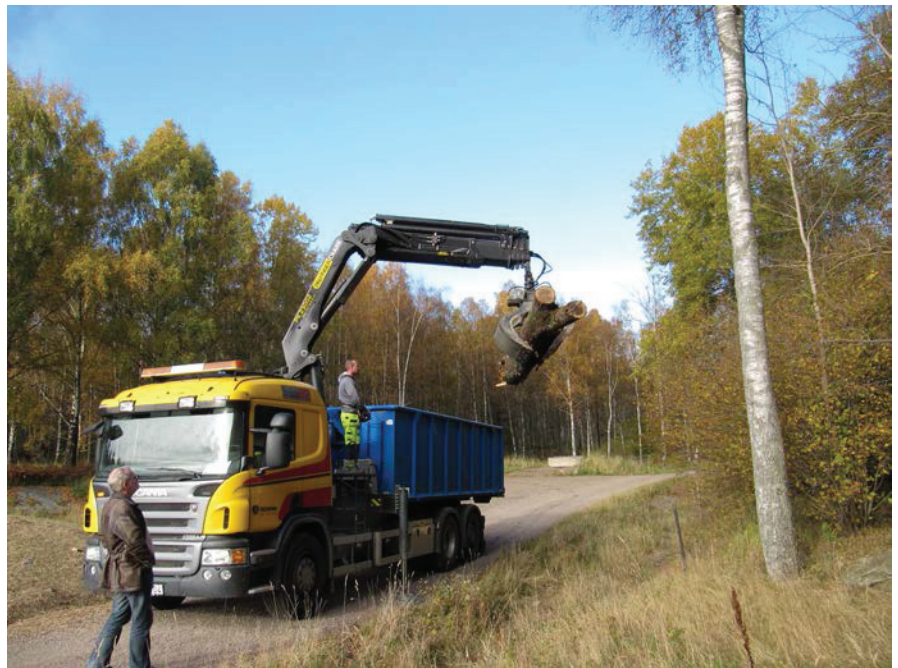
Istället för flisning - ut i skogen till det biologiska kretsloppet.

Delvis med Lund som förebild har ett arbete med att bättre ta hand om grova träd och samtidigt öka andelen död ved startat på Park- och naturförvaltningen. Syftet med de nya råden och riktlinjerna är att förändra rutinerna och ta tillvara de grova träden på ett mer kretsloppsanpassat sätt. Grova träd skall i framtiden inte gå till biobränsle utan användas som resurs för den biologiska mångfalden och som bindare av koldioxid - kolsänka. En inventering av grova träd i kommunen skall också göras inom ramen för Lokala naturvårdssatsningen (LONA) under 2011-2012.