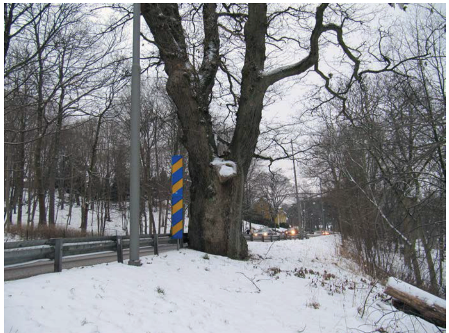
Stor och gammal ek i gatumiljö, den så kallade "Gränseken" i Bö i Göteborg, 2010.

När det gäller gamla, grova lövträd så utgör ofta tätorter kärnområden relativt det omgivande skogslandskapet. Detta kan tyckas paradoxalt, men det ger kommunerna och dess förvaltare stora möjligheter när det gäller att gynna den biologiska mångfald som är knuten till såväl levande som döda grova lövträd.