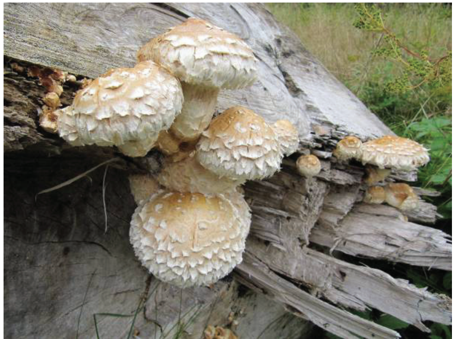
Poppeltofsskivling (Hemipholiota populnea), rödlistad (NT) som växer på nyss upplagda stockar av poppel i Grimbo på Hisingen, september 2010.

Torraka – ett stående dött, torrt träd (sidan 10).