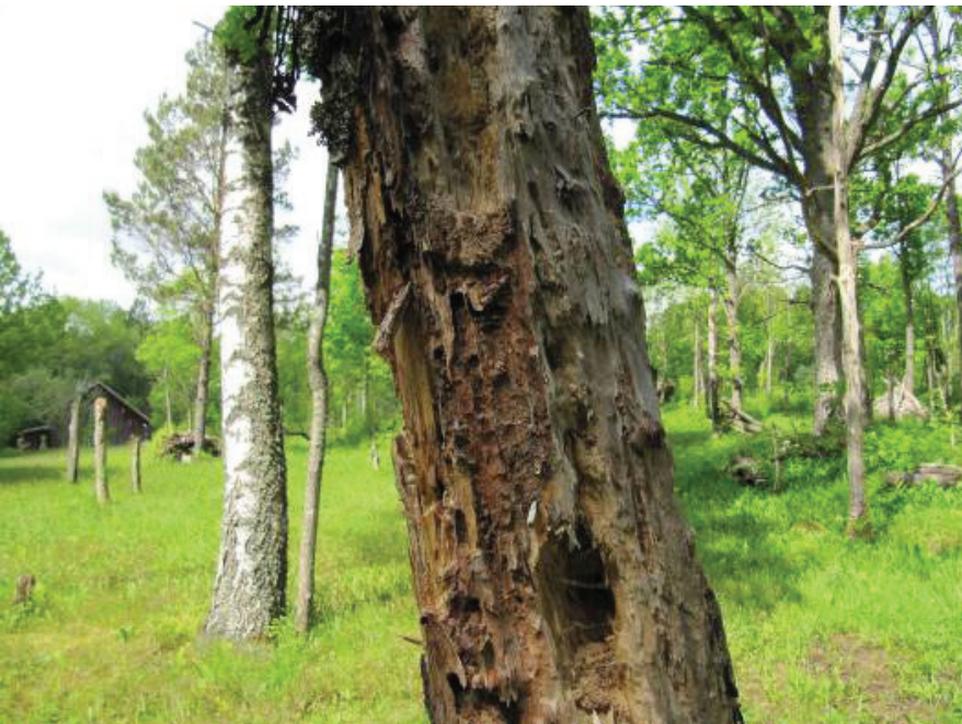
Först svamp och insekter – och sedan fåglar – så att snart inget finns kvar.