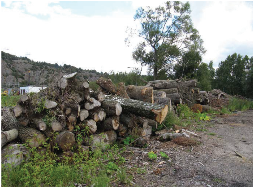
Träddepå – i väntan på klyvning och flisning, Alelyckan i Göteborg, 2010-09-10.

Som tidigare nämnts finns det kommunala mål om att öka andelen död ved. Under de senaste åren har det avverkats stora mängder grova träd i Göteborg. Det gäller främst träd i stadsmiljö, alléer och parker, beroende på stormfällning och av säkerhetsskäl. I regel har dessa träd lagts upp i olika depåer för att flisas till biobränsle. Extra grova träd, ibland mer än metergrova, har vållat problem genom att de är för stora att flisa direkt. Särskilda klyvar måste införskaffas för att först klyva och sedan flisa dem. Detta har alltså pågått trots målen om mer död ved och samtidigt som bristen på framförallt grova döda träd blivit allt allvarligare ute i skogar och andra grönområden och hotlistorna allt längre. Denna behandling av grova träd verkar inte vara unik för Göteborg utan snarare regel än undantag. Lunds kommun tycks vara något av pionjär med sitt projekt med faunadepåer. Även i kommunens natur- och grönområden brister det i rutinerna. Ofta lämnas för lite eller inget kvar som död ved. Det saknas fortfarande en fungerande strategi och riktlinjer när det gäller död ved och omhändertagande av grova träd.