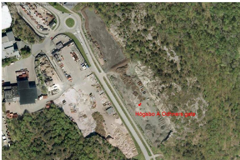
Högsbo 757:332, A Odhners gata